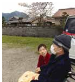
車椅子でお花見に