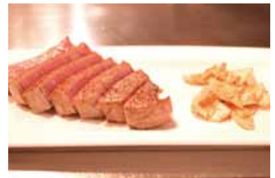
和牛フィレステーキ