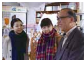
東京からきたデザイナーと

の仕組みづくりから始めました。今では播州織工房館で30社以上の商品が販売されています。常に新しい商品や情報を取り入れて発信していくことで注目を集めなくてははいけません。昔の西脇市はのぎり屋根の工場から織の音が響き、「集団就職」でやってきた女性従業員で賑わっていました。映画館もたくさんあつて街に活気がありました。人口が減っていくうち、ほとんどが空き店舗になってさびれる様子を見ました。だから今より一歩前に進むために若い人を呼び寄せ、新しい事をどんどんやってみて興味を持ってもらいたい。たくさんの人を巻き込み魅力ある西脇市にしたいと街が続いていかなければという気持ちです。私は西脇TMO推進室の管理する4施設は西脇の玄関口だと思います。西脇の良いところを紹介して一人でも多くの人に訪れてもらいたい。そして西脇に住んでいる人は西脇の良さを再発見してもらいたい。地場産業ともうまくコラボしていき、若い人が物を作るといふことを応援していきたいと思っています。