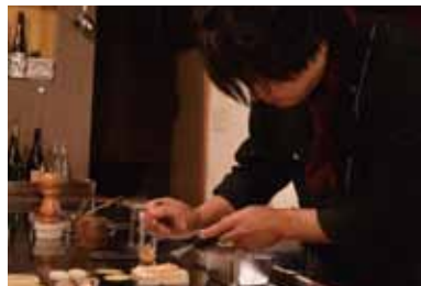
鉄板焼きの豪快さと、丁寧な技が融合