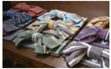
神戸芸術工科大学ともコラボした飾り帯

当初は補助金でできることはないかと模索するばかりでしたが、きちんと経営基盤を安定させるため