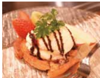
フレンチトースト