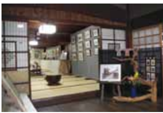
来住邸での展示風景